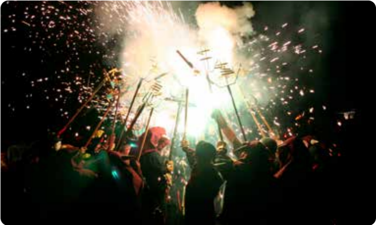
Interpretação Performers Charlie Dufau; Valentin Hironnelle;Rémi Lançon · Música Music Charlie Dufau · Ideia, cenografia, máquinas e efeitos Concept, set design, machines and effects Valentin Hironnelle · Automatismos e eletrónica Automations and electronics Coline Feral · Olhar externo e acompanhamento cénico External eye and stage accompaniment Jérôme Martin · Texto Text Francis Kasl · Difusão Touring Mathilde Idelet · Administração Administration ACROCS Productions · Produção Production ACROCS Productions · Apoio à criação Creation support ACROCS Productions – Targon, França; Atelier Alain Le Bras – Ville de Nantes, França; Garage Moderne – Bordeaux, França; Collectif Garage Lezarts – Lestiac, França; L’Entre-Vivre – Podensac, França; Les Oiseaux Mécaniques – Lestiac, França

Between sound, movement and delirious sonic images, a ritual is constructed where technology and emotion contaminate one another. B-O-M! transforms the public space into a place of play and undisciplined celebration, where continuing to play, to spin and to vibrate becomes an act of resistance. An imperfect mechanism that, like the blues, never closes, it simply waits for the next chorus.