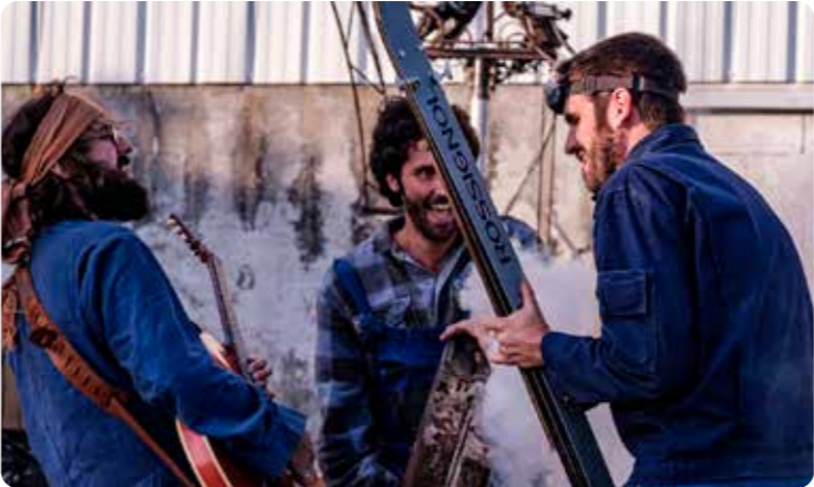
Direção artística Artistic direction Rémi Allaire;Éléonore Guillemaud · Escrita e encenação Writing and direction Rémi Allaire; Éléonore Guillemaud; Matthieu Neumann · Cenografia Set design · Matthieu Neumann · Composição musical Musical composition Yvan Talbot; Vanessa Hidden · Coreografia vertical Vertical choreography Antoine Le Menestrel · Coreografia Choreography Yasminee Lepe · Apoio à dramaturgia Dramaturgical support Rocio Berenguer · Engenharia estrutural Structural engineering Pierre Garabiol · Construção da estrutura aérea Construction of the aerial structure Arnaud Grasset; Anais Rocher; Eve Baudvin; Marianne Olivier · Figurinos Costume design Arnaud Jarsailion; Clotilde Laude · Interpretação Performers Acrobacias, aereas,dança,vertical Aerial acrobatics and vertical dance (6 acrobatas selecionados selected acrobats): Lutz Christian; Eva Manin; Luah Marquez; Maëlys Rousseau; Fantin Sequin; Gal Zedee; Emilie Gressi; Isabelle Falcomata; Aourel Krausse Discussão Discussion (7 músicos selecionados selected musicians): Agathe Bednarz; Auric; Fumet; Aurélien Escala; Ivan Talbot;Joel Catalan; Julien Ragaigine; Kahtwan Cheikh; Lucas Comte; Marie Frier; Olivier Mirande; Ornella Debono; Sylvain Esnault; Tiphaine Haouy; Tiphaine Moreau; Mario Allègre Yoz Yoiz Sara Giommetti; Vanessa Hidden; Anandha Seethanan · Direção de cena Stage direction Thomas Boccard; Tintin Orsoni · Direção técnica Technical direction Loïc Marjion · Riggers Riggers Béatrice Contreras; Nicolas Lourdelle · Desenho e operação de iluminação Lighting design and operation Arnaud Barbieri; Agathe Patonnier · Operação de som Sound operation Marc-Alexandre Marzio · Secretariado-geral General secretary Yannick Vallin · Administração e produção Administration and production Lucie Roibet · Produção e difusão Production and touring Mélanie Masson; Alexandre Rebiere · Coprodução Co-production Le Cratère – Scène Nationale (Alès); Le Moulin Fondu – CNAREP (Garges-lès-Gonesse); Atelier Z31 – CNAREP (Sotteville-lès-Rouen); Le Parapluie – CNAREP (Aurillac); Nil Admirari / Nil Obstrat (Saint-Ouen-l’Aumône); L’Abattoir – CNAREP (Chalon-sur-Saône); Scène Nationale Espace des Arts (Chalon-sur-Saône); Quelques p’Arts – CNAREP (Boullieu-lès-Annonay) · Apoios Support Ministério da Cultura de França – DGCA French Ministry of Culture – DGCA; Auvergne-Rhône-Alpes · Outros apoios Additional support Béal Company; SACD – Copie Privée; SPEDIDAM

ADN proposes a gesture of elevation that offers no answers. It places the human being before the recurring desire to surpass limits and reminds us that imagining the future also means confronting risk, instability and the consequences of always building higher.